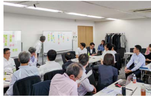
人権デュー・ディリジェンス ワークショップ